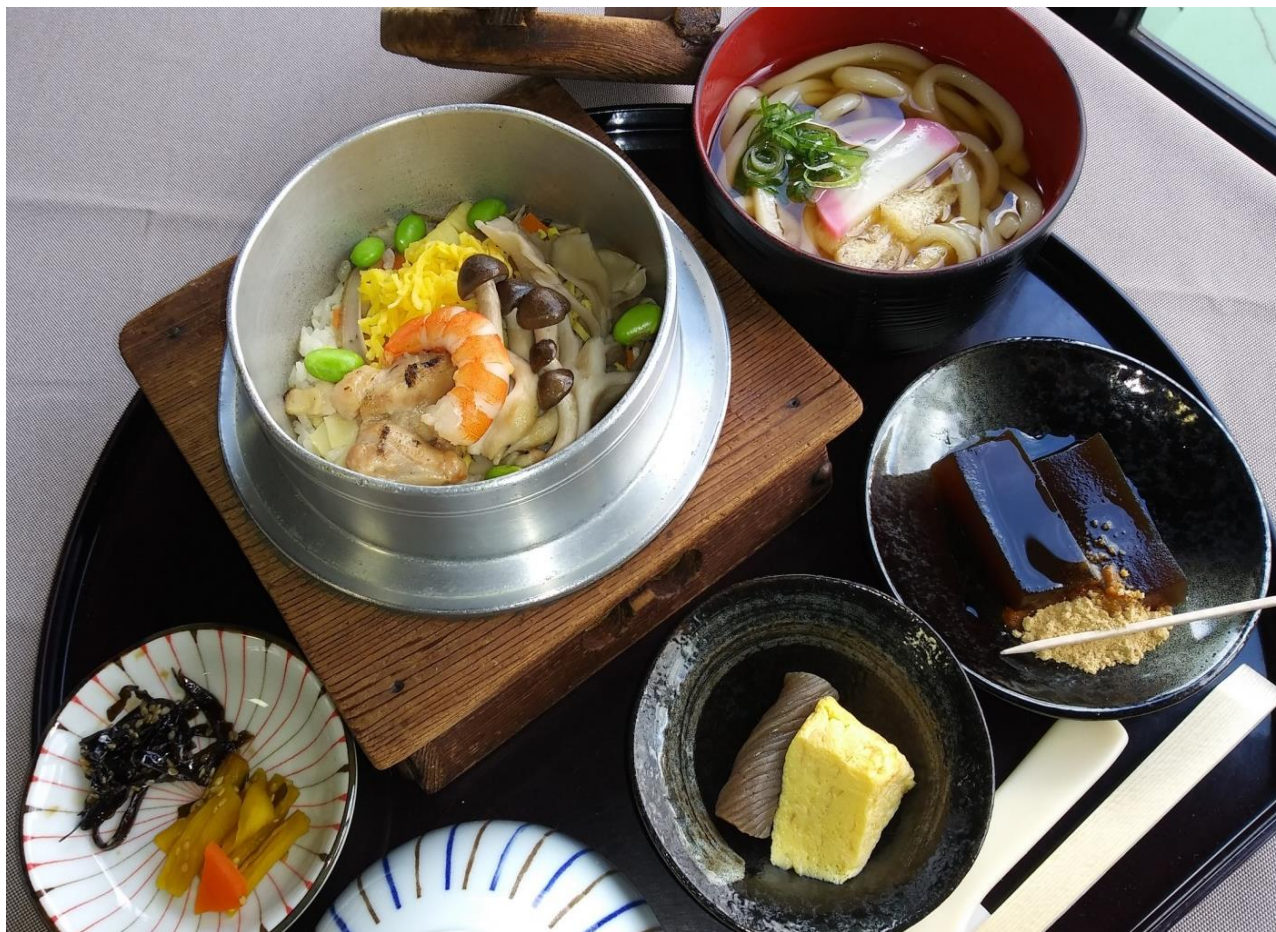
写真はミニうどん付